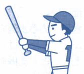
スポーツ、海・山 のレジャー時に