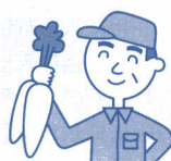
農業・漁業 の職場で