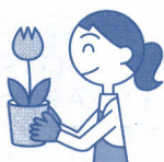
ご家庭での 園芸時に