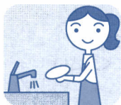
ご家庭での 水仕事に