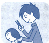
美容院、理髪店 の職場で