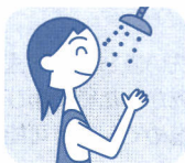
お風呂、プール などの入水時に