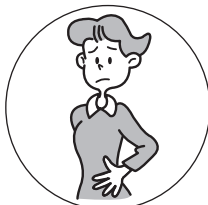
おなかが はったときに