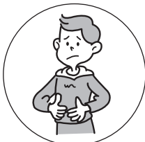
おなかの弱い方の 整腸に