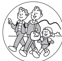
旅行など環境の変化で おなかの調子をくずしたときに